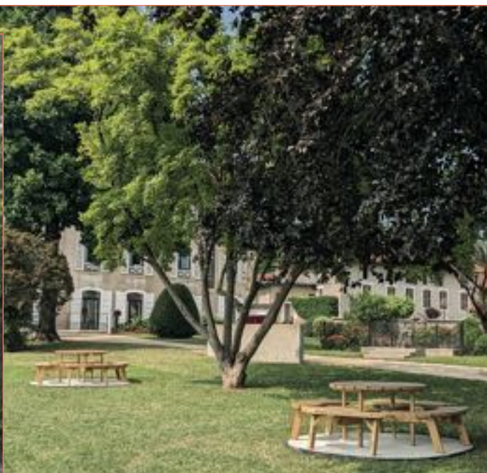
Deux nouvelles tables de pique-nique ont été installées dans le parc municipal à l'ombre des arbres.