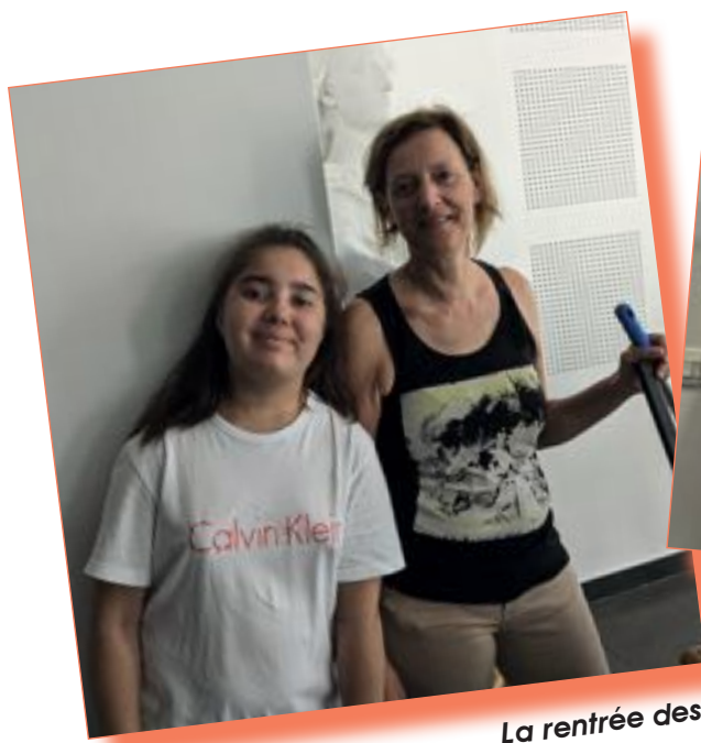
La rentrée des agents