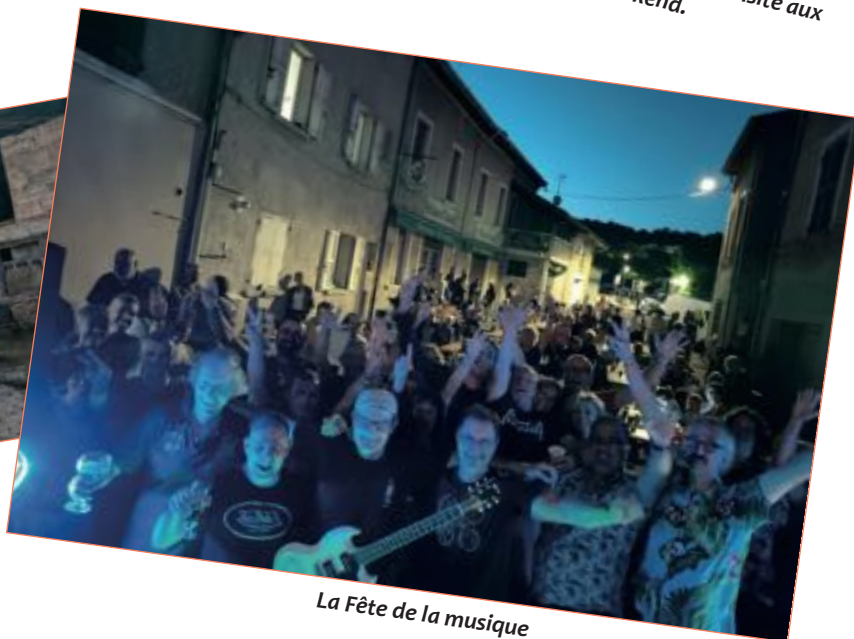
La Fête de la musique