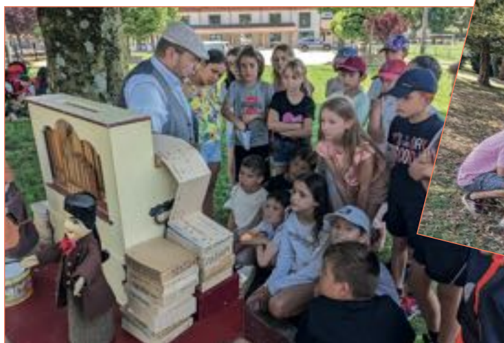
Le Relais Petite Enfance Vourey ainsi que les enfants du périscolaire ont pu pique-niquer aux sons de l'orgue de Barberie.