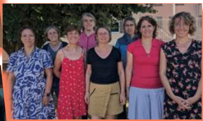
La rentrée des professeures des écoles