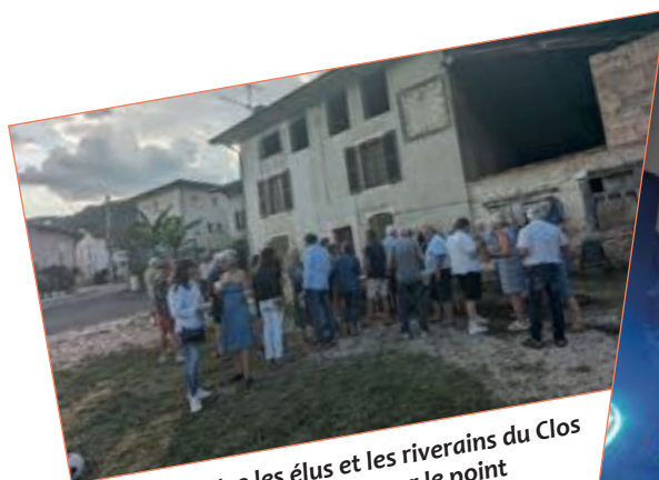
Rencontre entre les élus et les riverains du Clos du Sanissard pour échanger sur le point d'apport volontaire en fonctionnement depuis plusieurs mois.