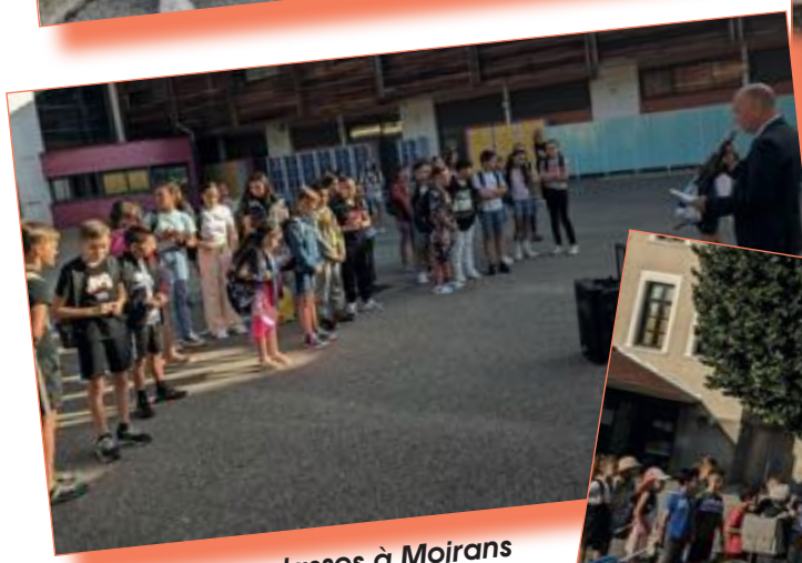
La rentrée des classes à Moirans pour les collégiens