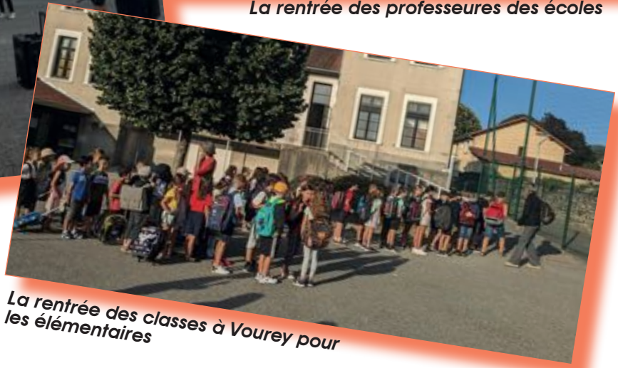
La rentrée des classes à Vourey pour les élémentaires