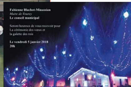
Fabienne Blachot-Minassian Maire de Vourey Le conseil municipal Seront heureux de vous recevoir pour La cérémonie des vœux et la galette des rois Le vendredi 5 janvier 2018 20h

boulangier, en profitant pleinement de l'ensemble du gymnase pour échanger avec les élus, très disponibles cette année, et les nombreux présents habitués de l'événement.