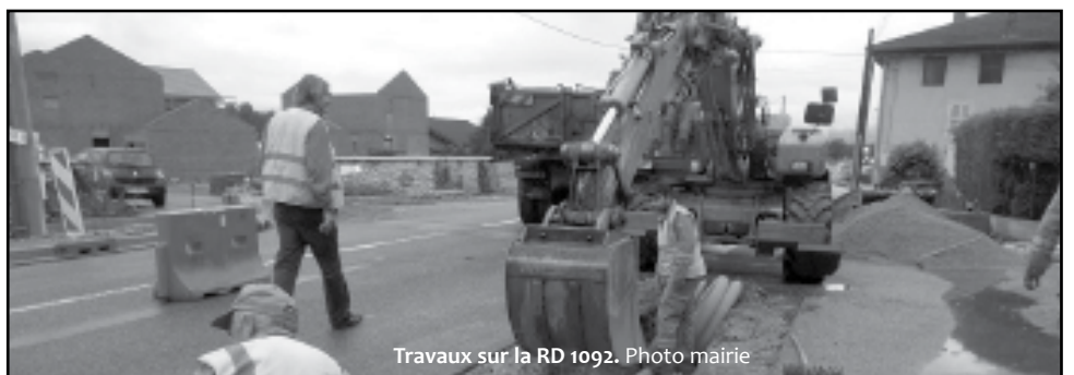
Travaux sur la RD 1092.

Sans oublier la pogne... date à déterminer.