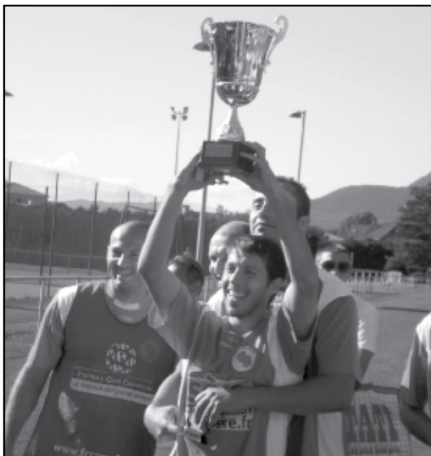
Les séniors lors de la finale du challenge Sud-Isère.

Les vétérans ont remis à l'ADMO (Association pour le Don de Moelle Osseuse) un chèque correspondant à l'ensemble des cotisations des participants.